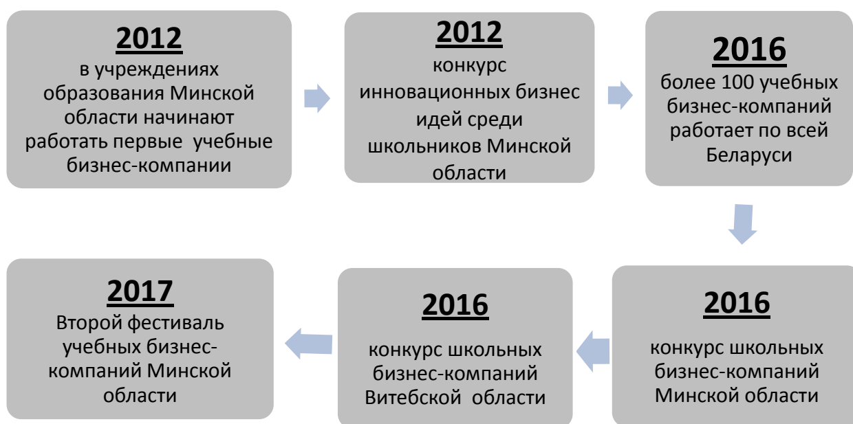
Рисунок 1. Развитие идеи учебных бизнес-компаний в Республике Беларусь.

Одной из новаций практического обучения экономике и предпринимательству современных школьников стала инициатива по организации учебных бизнес компаний (УБК). Старт идея получила в 2011 году, а в 2016-2017 учебном году по всей Беларуси работало порядка 200 таких компаний (рис. 1).