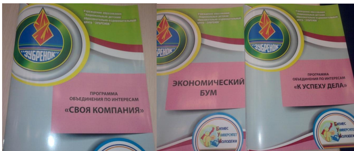
Рисунок 3. Методические разработки тематических экономических смен НДОЦ «Зубренок».

Актуальный проект по обучению молодежному предпринимательству и предприимчивости реализуется Национальным детским образовательно-оздоровительным центром «Зубренок». Там в рамках проекта «БУМ - Бизнес-университет молодежи» разработана и проведена уникальная тематическая смена «Экономический бум», реализована программа объединения по интересам «К успеху дела» и «Своя компания» для учеников 9-11 классов (рис. 3).